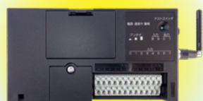
小型遠隔監視通報装置 FMT300