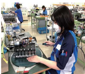
専任技術者による確かな作業