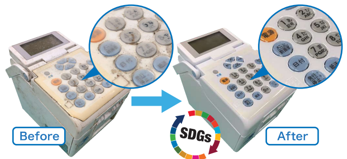
クリーニングにより新品同様の外観