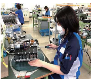
専任技術者による確かな作業