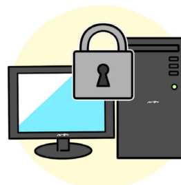
データのアクセス制限

※ISMS(情報セキュリティマネジメントシステム)=企業における総合的な情報セキュリティを確保するためにはISMSの構築・運用が必須事項といわれています。